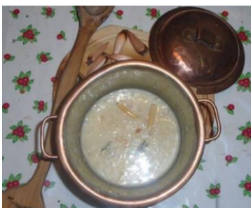
Sopa crema de Pehuenes

13.00 h - Almuerzo de cierre, quincho FASTA. Los protagonistas del “Taller de Recuperación de Ingredientes y Recetas Originarias” , “Cocineros del Ñireco” , cocinarán.